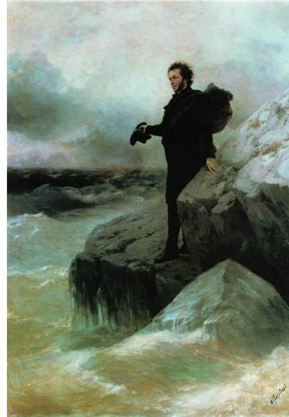
«Прощание Пушкина с Черным морем» И. К. Айвазовский, Николаевский художественный музей имени В. В. Верещагина