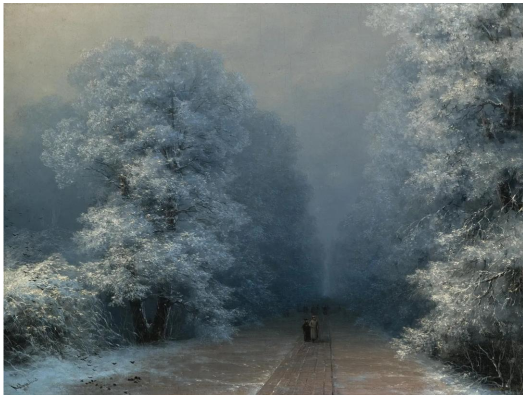
«Зимний пейзаж» И. К. Айвазовский, Находится в частной коллекции