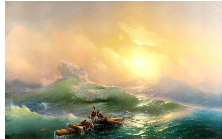
«Девятый вал» И. К. Айвазовский, Русский музей, Михайловский дворец

Издравле для русского народа морская стихия была синонимом свободы, Айвазовский стремится передать эти чувства в картине "Девятый вал". Необычным было не только ее наименование, но и тематическое содержание, оно построено на сложном противопоставлении драматического сюжета и яркого, мажорного, живописного воплощения образа. На картине изображено раннее утро после бурной ночи, первые лучи солнца осветили бушующий океан и громадную волну - девятый вал, - готовую обрушиться на группу людей, ищущих спасения на обломках мачт погибшего корабля. Картина наполнена глубоким внутренним звучанием.