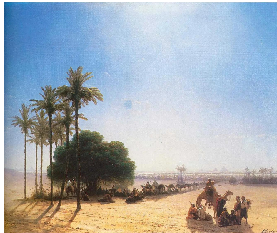
«Караван в оазисе. Египет» И. К. Айвазовский, Находится в частной коллекции