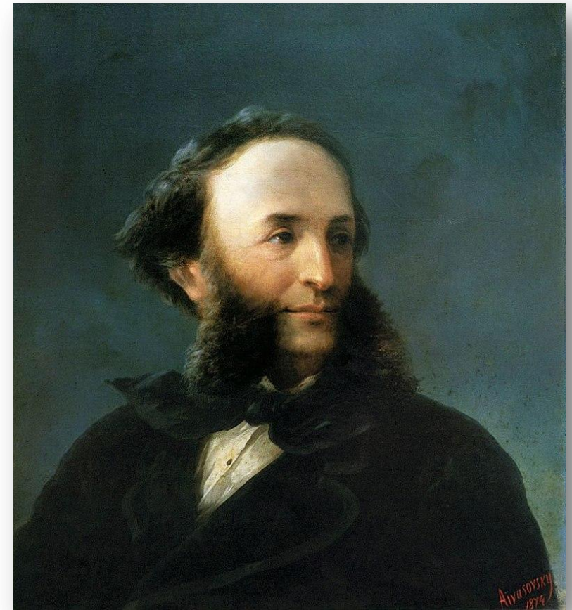
«Автопортрет» И. К. Айвазовский, Феодосийская картинная галерея, Феодосия

Вот уже прошло 205 лет со дня рождения великого русского художника Ивана Константиновича Айвазовского. Его творчество вызывает глубокий интерес и чувство восхищения у людей, самых различных по возрасту, профессии и душевному складу. Выдающийся художник второй половины прошлого века, Айвазовский и в наши дни остается одним из самых популярных мастеров русской школы.