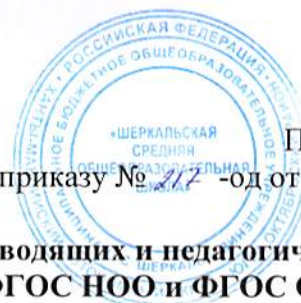
График повышения квалификации руководящих и педагогических работников при переходе на обновлённые ФГОС НОО и ФГОС ООО